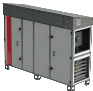
DUOVENT® COMPACT DV 4200 + ROOFPACK-A