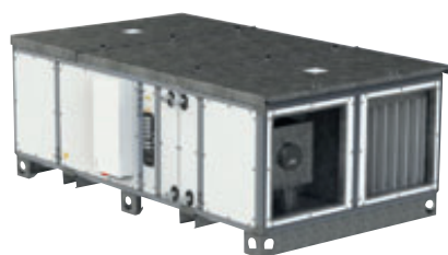
DUOVENT® COMPACT DV 4200 + ROOFPACK-A

Příklady provedení ROOFPACK-A pro vertikální a horizontální provedení jednotek